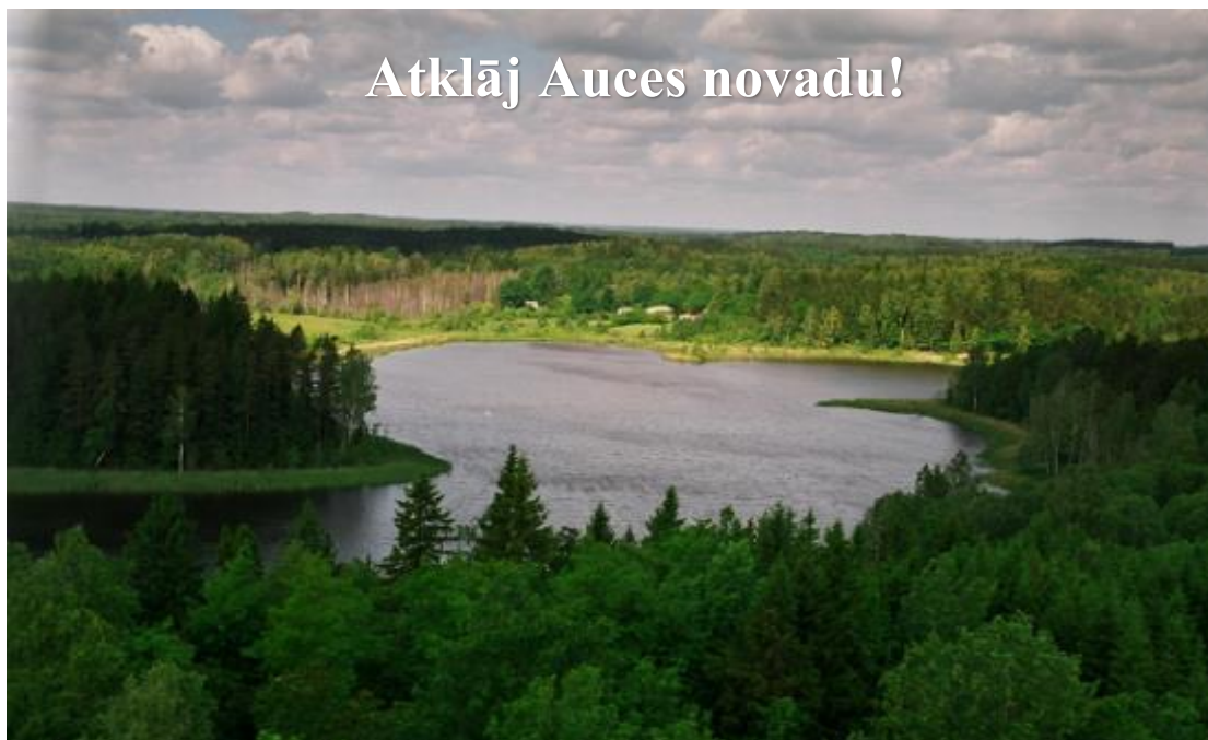
Skats uz Sesavas ezeru Īles pagastā

Auces novads „ērti” iekārtojies Latvijas dienvidos - pie pašas Lietuvas robežas, vietā, kur Zemgales līdzenumi plūstoši pārvēršas Kurzemes paugurainēs. Līdz ar to Auces novada 517,8 km 2 lielajā teritorijā rodams skaistākais un vērtīgākais no abiem vēsturiskajiem novadiem – auglīgas, plašas un labi iekoptas lauksaimniecības zemes, kas mijās ar ainaviskiem pauguriem, zaļiem mežiem un dzidriem, zivīm bagātiem ezeriem.