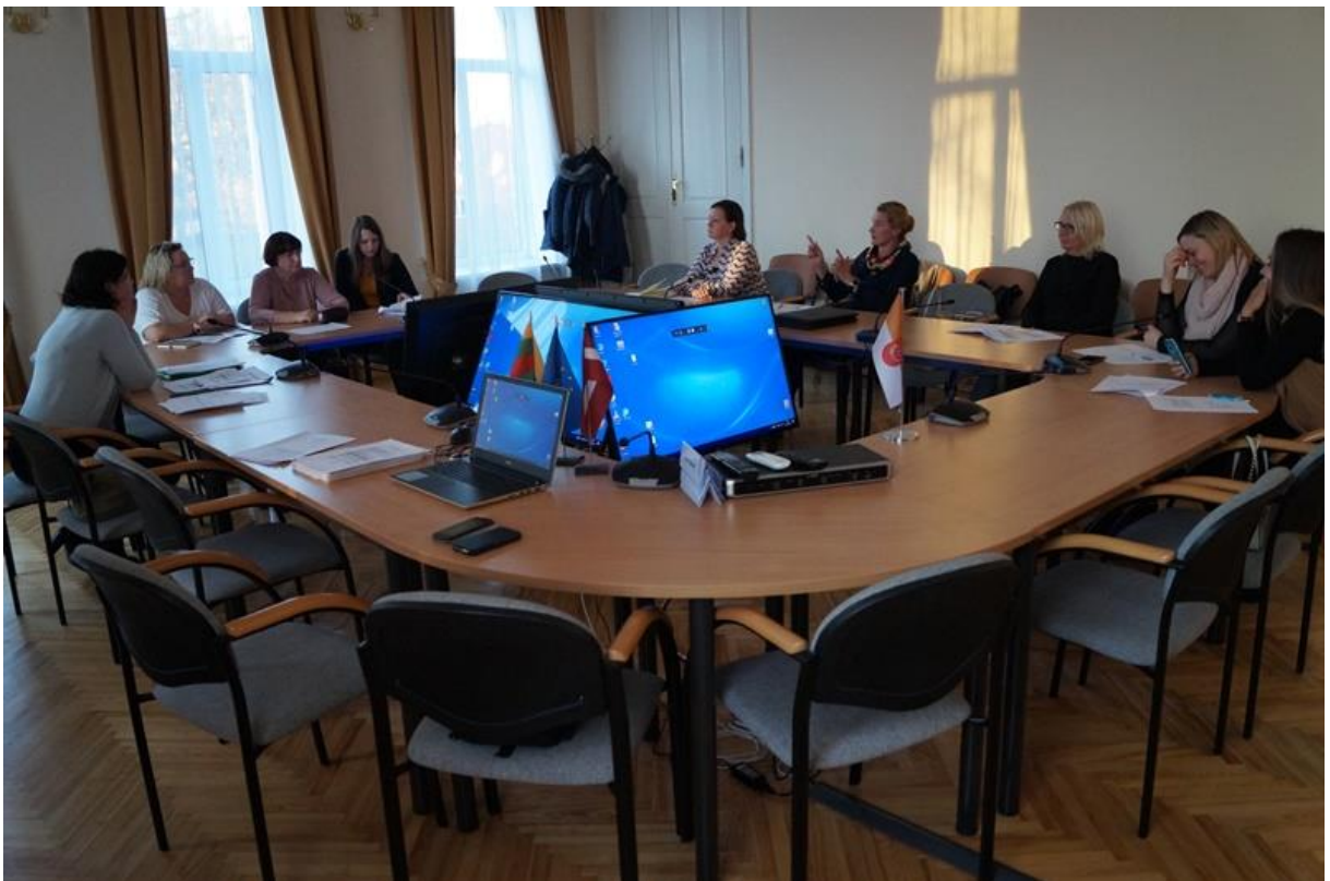
Projekta vadības grupas sanāksme dienas otrajā pusē.