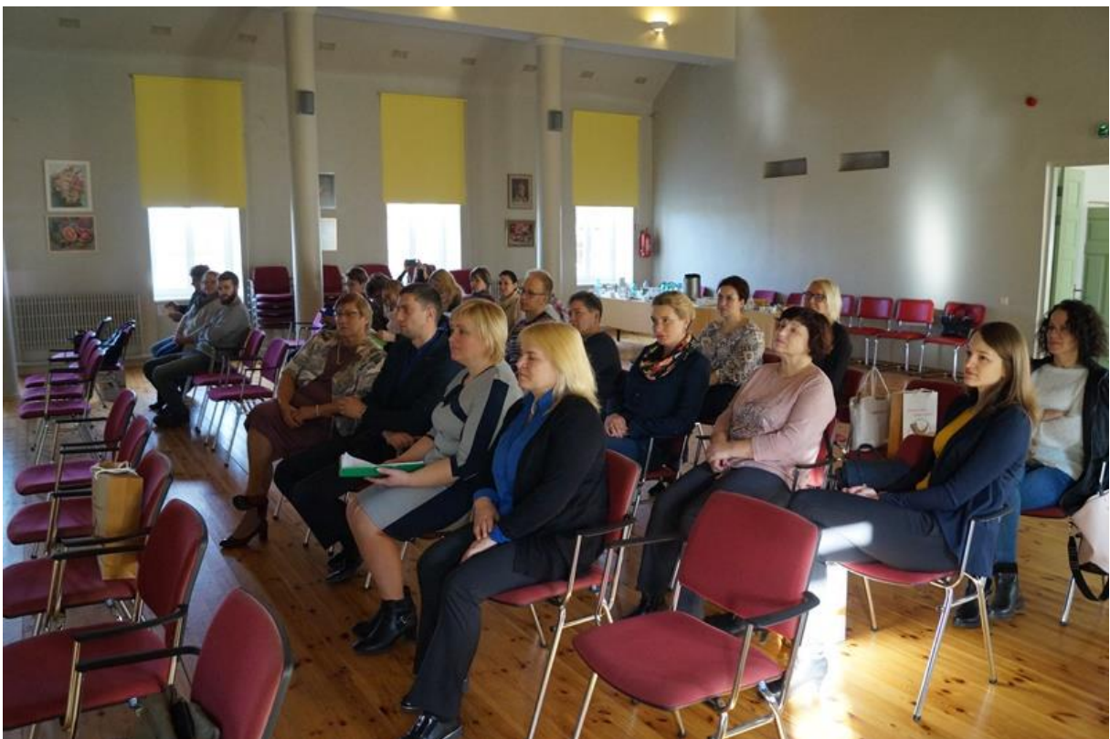
Sadarbības partneri projekta pasākuma norises vietā - Lielaucē Tautas namā.