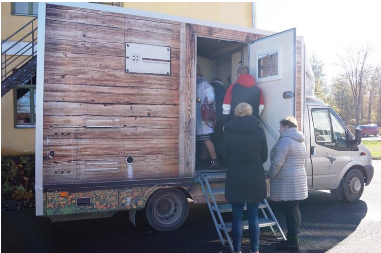
Projekta partneri iepazīstas ar Latvijas Samariešu apvienības sniegto pakalpojumu "Mobilā aprūpe mājās".