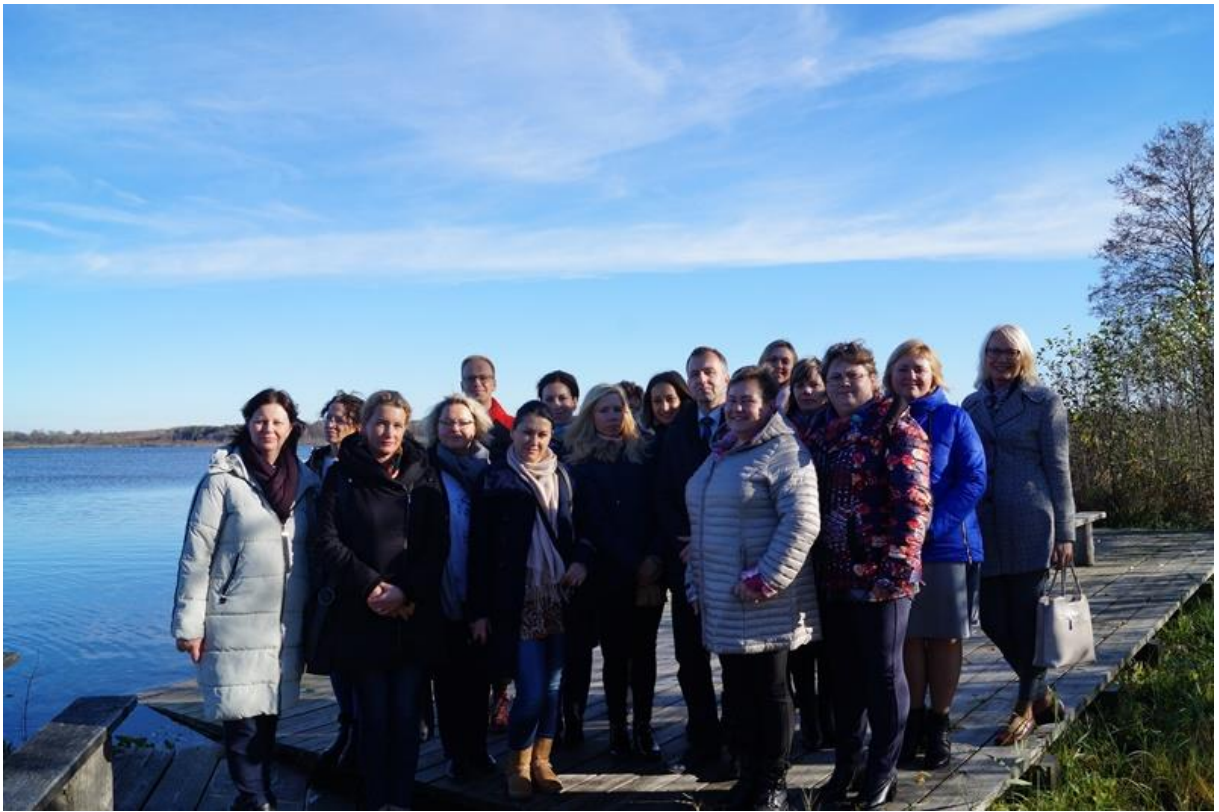
Projekta pasākuma dalībnieki no Zemgales plānošanas reģiona, Auces, Dobeles, Viesītes pašvaldībām un Rokišķu, Jonišķu un Kretingas pašvaldībām Lietuvā.